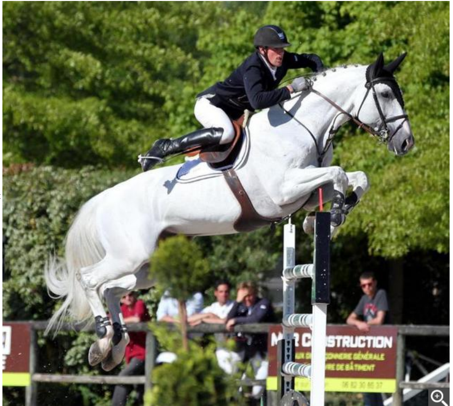
Le saut du cheval est une discipline toujours très spectaculaire.