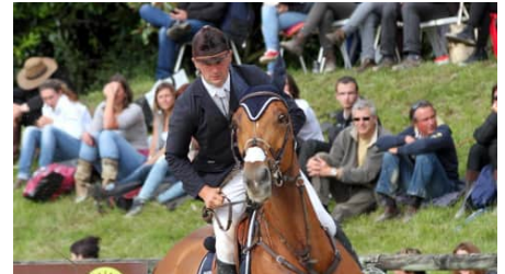
Bel Air soigne son Grand National