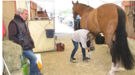
Cinq cents chevaux, leurs cavaliers et leur staff accueillis à Pernay