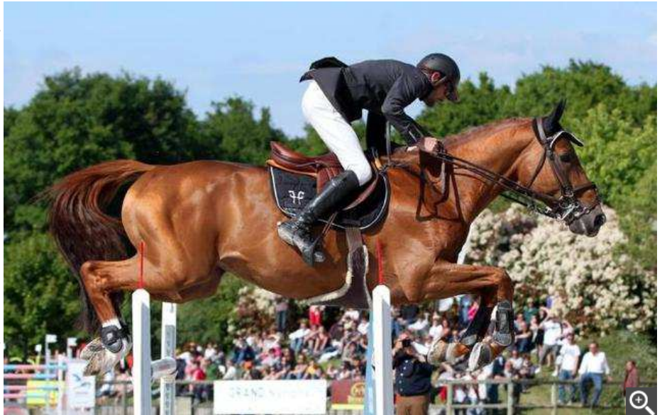
La piste et les parcours de Pernay sont au top niveau. - (Photo archives NR, Ludovic Dupraz)